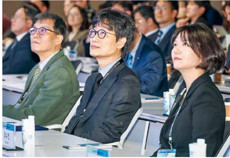
왼쪽부터 지난 21일 서울 중구 한국은행 콘퍼런스홀에서 열린 2026 한국은행-네이버 공동 AX 콘퍼런스와 같은 날 성남 판교 NC AI 본사에서 열린 NC AI-중소기업기술혁신협회 AI 활용 경쟁력 강화 업무협약 모습.

네이버는 이를 바탕으로 중앙부처와 금융 기관으로 공공 AI 전환을 확산한다는 계획으로, 헬스보다 실제 쓰임새로 소버린 AI를 입증하겠다는 전략이다.